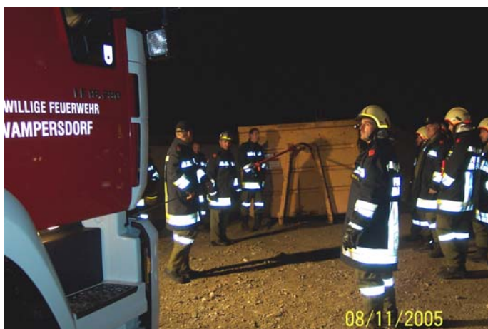
Seilwinde im Einsatz

Am Dienstag, den 8. November 2005, fand die monatliche Zugübung der FF Wampersdorf statt. Thema war die Verwendung von Zug- und Hebemitteln, die sich im neuen RLFA 2000 befinden. Geübt wurde vor allem mit den für die FF Wampersdorf neuen Geräten (Hebekissen, Seilwinde und Greifzug). Als Platz für die Übung wurde das Areal der Fa. Szoldatics gewählt, da sich dort viele geeignete Übungsobjekte befinden. Der Firma sei an dieser Stelle herzlich gedankt.