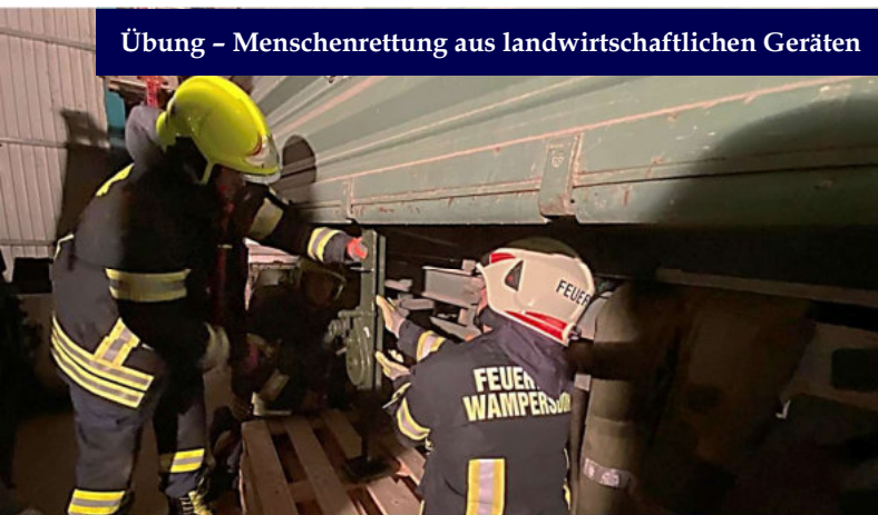
Übung - Menschenrettung aus landwirtschaftlichen Geräten