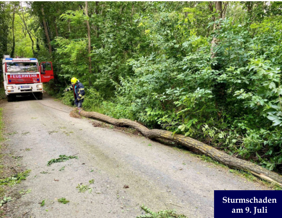
Sturmschaden am 9. Juli