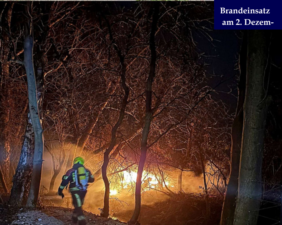
Brandereinsatz am 2. Dezem-