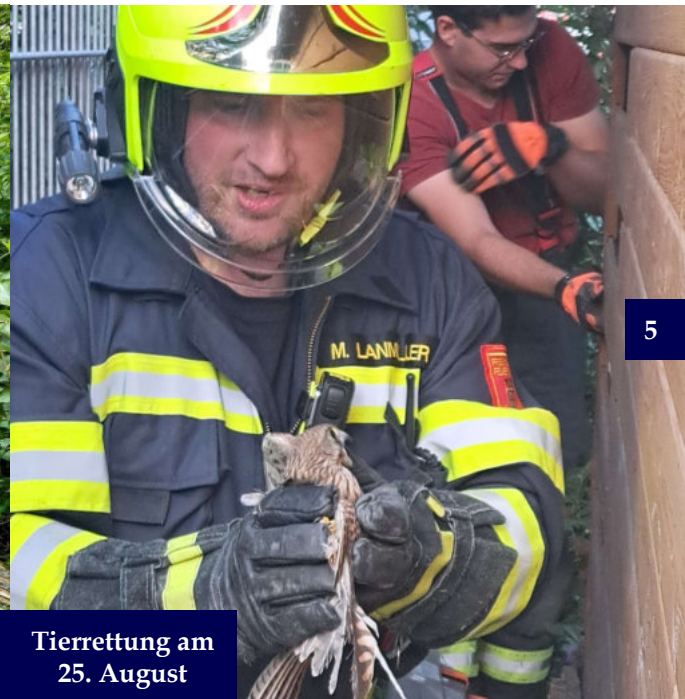
Tierrettung am 25. August