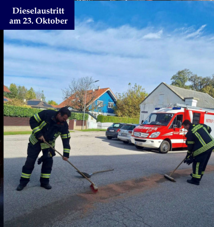
Dieselaustritt am 23. Oktober