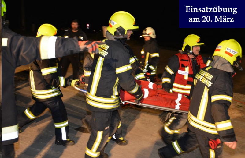
Einsatzübung am 20. März