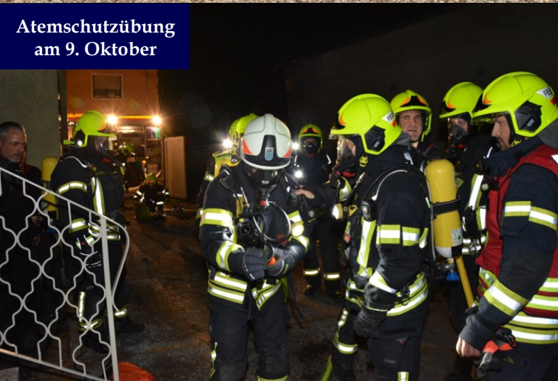
Atemschutzübung am 9. Oktober