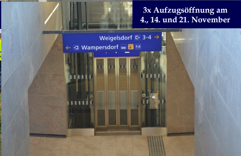
3x Aufzugsöffnung am 4., 14. und 21. November