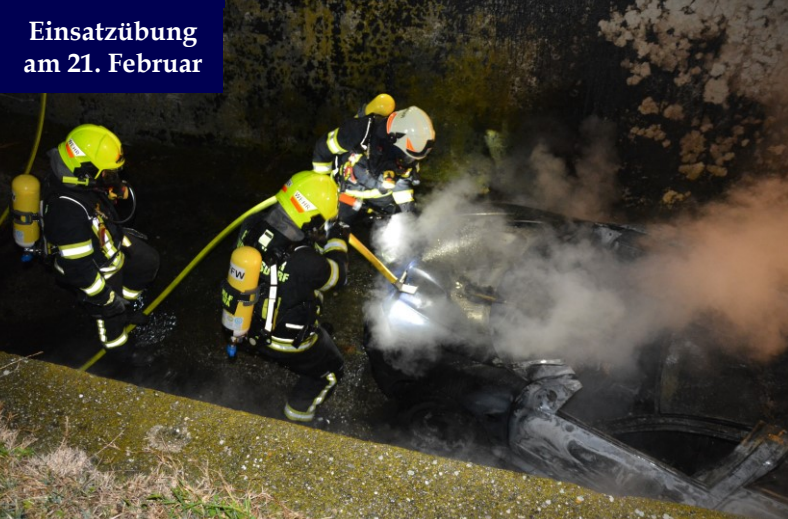
Einsatzübung am 21. Februar