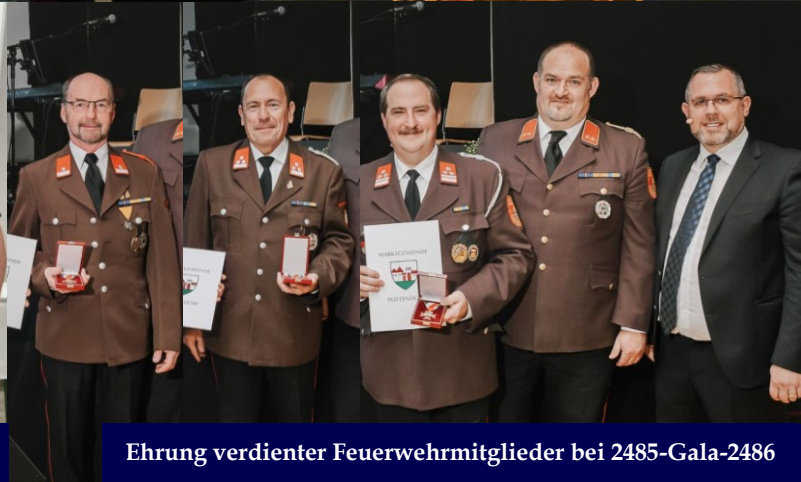
Ehrung verdienter Feuerwehrmitglieder bei 2485-Gala-2486