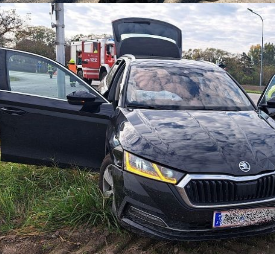
Verkehrsunfall am 28. Oktober