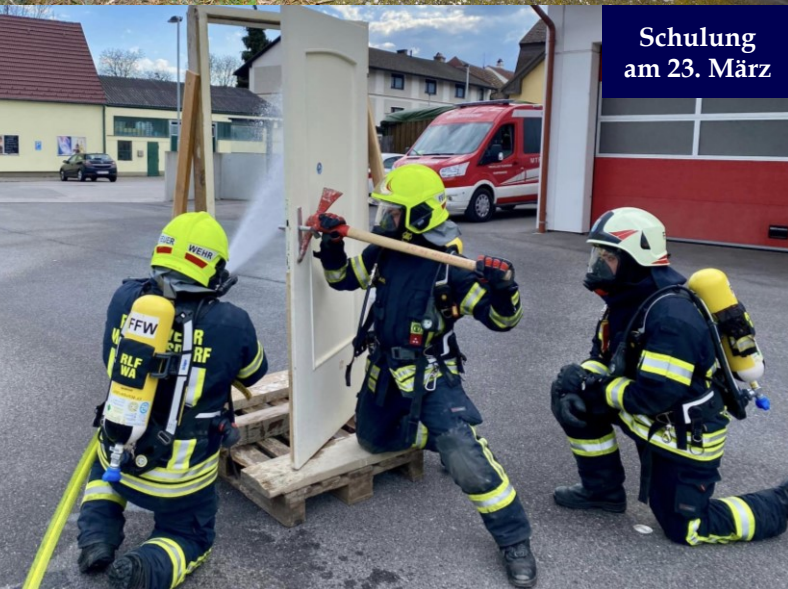
Schulung am 23. März