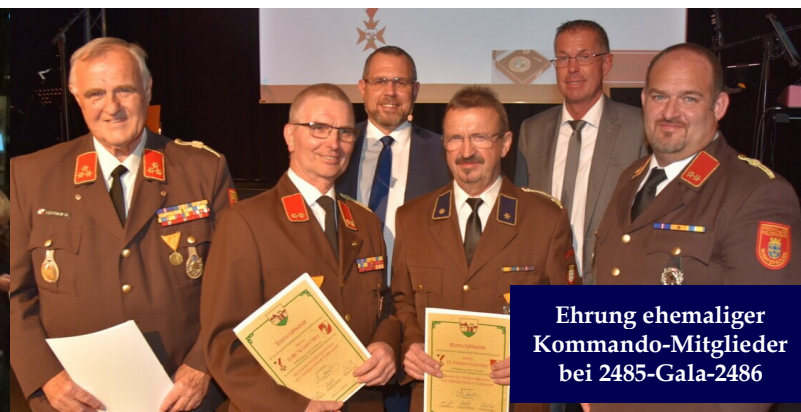
Ehrung ehemaliger Kommando-Mitglieder bei 2485-Gala-2486